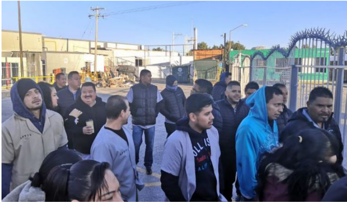
Trabajadores de Aptiv en paro

En Chihuahua, las plantas de Ciudad Juárez y Parral detuvieron sus labores el viernes 31 de enero: “Nos quitaron dinero de nuestra nómina esta semana, ahora resulta que todos salimos debiendo al SAT”. “La única razón que nos dieron fue que sería efectuado el recorte para cubrir el aumento que realizó el gobierno federal en el ISR y que sería para cubrir pre-