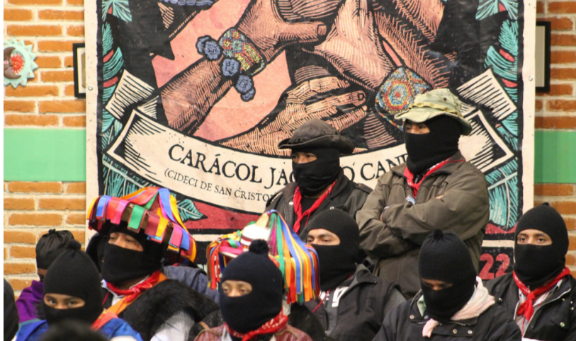
Zapatistas en el Foro (Foto: Radio Zapatista)

En las diferentes luchas en nuestro país —la Independencia, la Revolución— han participado mu-