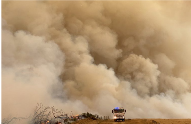
Incendio en la Isla Canguro, Australia

que supuestamente los países del mundo reforzarían sus compromisos de acción climática para 2020. Antes de la COP25, los científicos publicaron varios reportes con la vana esperanza de presionar a los gobiernos a ponerse de acuerdo sobre una acción real, pero Estados Unidos y sus aliados en el ámbito de los combustibles fósiles incluso impidieron que la COP25 llamara a los países a hacer tales compromisos, si bien el texto final de la conferencia admite el