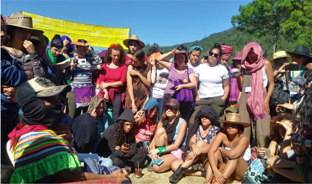
Zapatista respondiendo preguntas en el Segundo Encuentro de Mujeres que Luchan

Durante el encuentro, también, las mujeres zapatistas compartieron sus experiencias y saberes, tanto en la lucha como en la vida diaria. Se les veía rodeadas de pequeños grupos de mujeres que iban tomando turnos para hacerles preguntas a las que ellas siempre respondían de la mejor forma, invitando al respeto a la diferencia de pensamiento, a la empatía