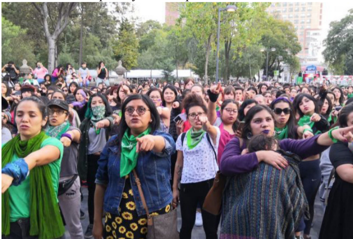
Mujeres interpretan Un violador en tu camino en la Alameda Central en Ciudad de México

La respuesta global que comenzó en la década de 1960, cuando las mujeres marcharon para “Recuperar la noche”, ha tomado un rumbo notable y creativo. Dio un salto adelante en el Día de San Valentín de 2013 con la acción Un Billón de Mujeres en Pie contra la Violencia, la cual convocaba a las mujeres a hacer un paro y bailar para llamar la atención