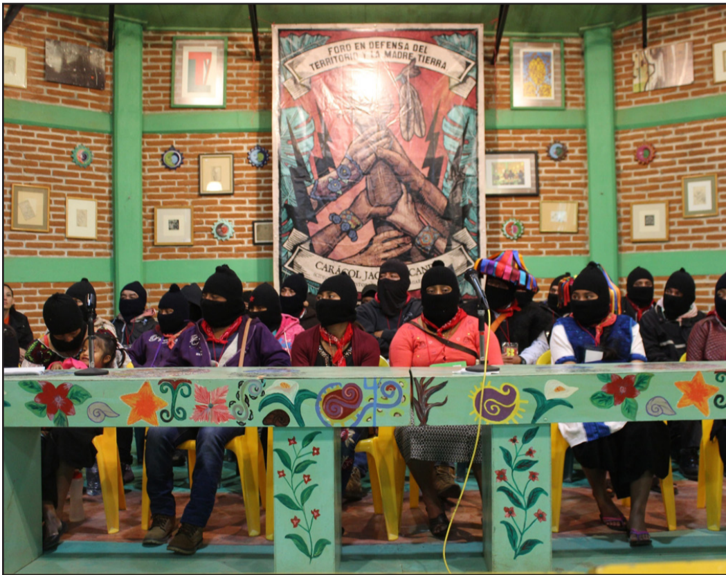
Foro en Defensa del Territorio y la Madre Tierra

Fue en este foro donde pudimos escuchar las voces desde abajo de pueblos originarios que se han estado enfrentando a la arremetida del capitalismo neoliberal, el cual los despoja de sus tierras y desplaza