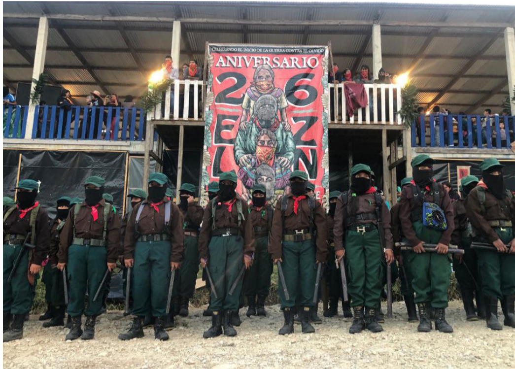
26 aniversario del EZLN

Es precisamente esto, la filosofía y la acción de la revolución permanente, lo que necesitamos desarrollar como respuesta a la pregunta que los zapatistas nos están haciendo. Esto, nos parece, es lo que está en el centro del cuestionamiento “¿Cuál es el desafío para nosotr@s?”