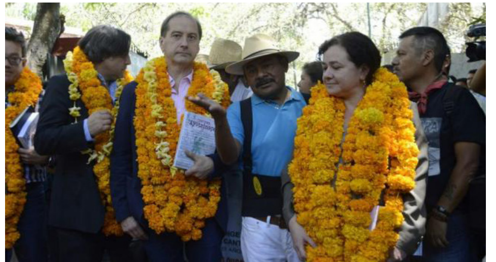
Presentación del reporte del GIEI en Ayotzinapa