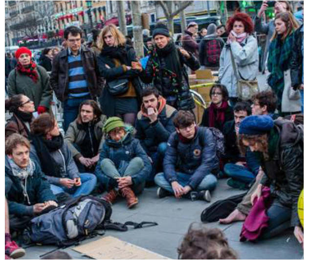
Asamblea en la plaza central de París

En Grecia, Serbia y Hungría se han erigido muros y bloqueos militares. En Bulgaria, los refugiados han sido perseguidos y golpeados por grupos extra-legales que son aplaudidos por los medios de derecha. De igual forma, la extrema derecha se ha valido de la situación