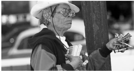
Economía informal: 60%