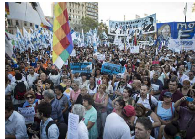
Manifestación contra Macri en Argentina

Si, en un principio, las conducciones sindicales habían dividido al movimiento desde arriba , son los mismos trabajadores los que, a partir de otras conduc-