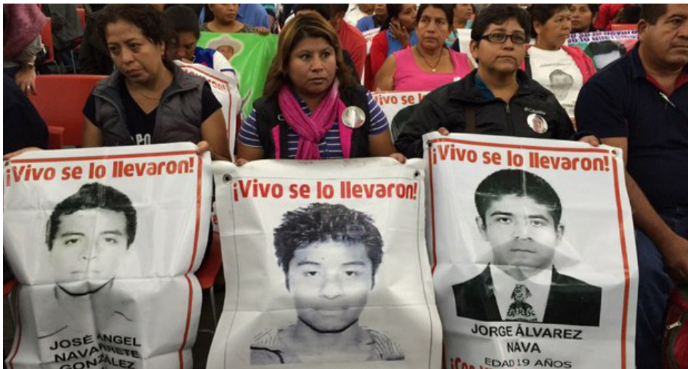
Marcha por Ayotzinapa en septiembre de 2015