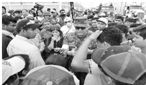
Explosión en la planta Clorados III