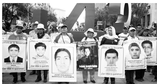
La lucha por Ayotzinapa continúa

Fui a la manifestación del Día del Trabajo en el Zócalo de la ciudad de México. Como de costumbre, fue una marcha grande con muchos grupos y tendencias diferentes. Al mismo tiempo, me parece que es importante leer "Un año de luchas laborales en México: ¿qué significan?", el artículo principal del número 7 de Praxis , en el cual se habla de la importancia de la relación entre las manifestaciones y las luchas desde abajo , por una parte, y la necesidad de desarrollar ideas, teoría para la transformación social, por otra. En la manifestación, faltaba este tipo de diálogo, el cual es muy necesario para enfrentarse al autoritarismo de Peña Nieto y a la sociedad mexicana corrupta.