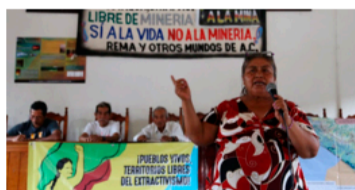
Chiapas: Sí a la vida, no a la minería

El desarrollismo de López Obrador, un peligro para la emancipación humana