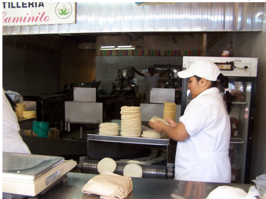
Trabajadora en una tortillería

Me llevaron con la jefa del área de tortillería y me dio una explicación de todo lo que se producía en esa área. La verdad es que esa área no era tan fácil como yo lo creía. Había muchas cosas por producir, pero hasta ese momento había cinco elementos. Contando a la jefa y conmigo ya éramos seis, y entre rumores y charlas que ha tenido la jefa con su jefa he escuchado que necesitamos ser ocho. Desde el primer día que empecé a trabajar ha sido pesado, porque el desgaste es físico, y la verdad es que sí hacían falta más elementos, porque la producción del día a veces no se completaba para las metas establecidas.