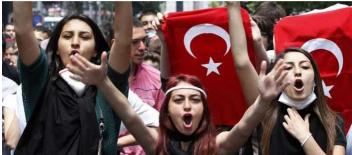
Día Internacional de la Mujer en Turquía

Erdoğan y sus secuaces difundieron la mentira de que los manifestantes, "bajo la apariencia del día de las mujeres [...] le silbaron a nuestro azan [...] Corearon slogans". Erdoğan continuó: "Su única alianza es la enemistad contra el azan y la bandera". Esto pasa por alto a los cientos de mujeres musulmanas con velo que fueron gaseadas por los policías en la manifestación. El Diyanet-Sen (sindicato para empleados de la Dirección de Asuntos Religiosos) exigió que el gobierno investigara y que los manifestantes se disculparan con la población turca, a pesar de