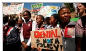
Estudiantes en Sudáfrica protestan por el caos climático

La elección de la humanidad: libertad y revolución, o fascismo, guerra y genocidio