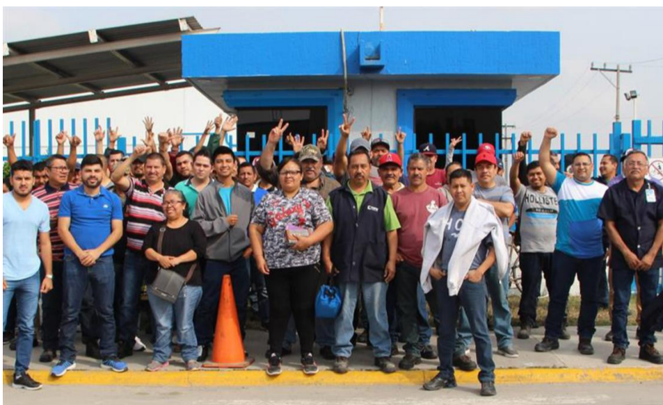
Huelga de trabajadores de la maquila en Matamoros

pora para robarlos descontándoles 4% de su salario, no para defender sus derechos, sino para servir al patrón. El sindicato fue incapaz de frenarlos. De nada le sirvieron al patrón las amenazas de despido y los mecanismos de control dentro y fuera de las fábricas.