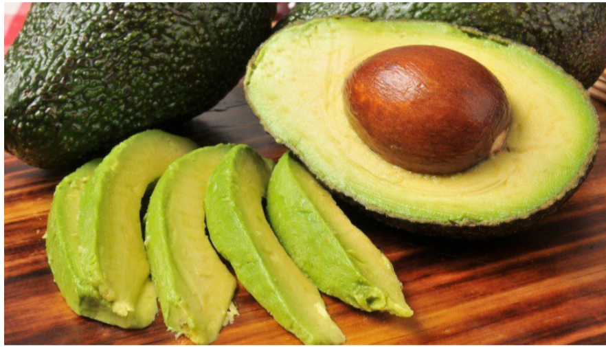
Aguacate, el “oro verde” de Michoacán

Nosotros hemos decidido cambiar de rumbo, porque es ahora o nunca que hay que hacerlo. El calentamiento global es una realidad y el aumento de la población humana nos obliga a cambiar de vida y tal