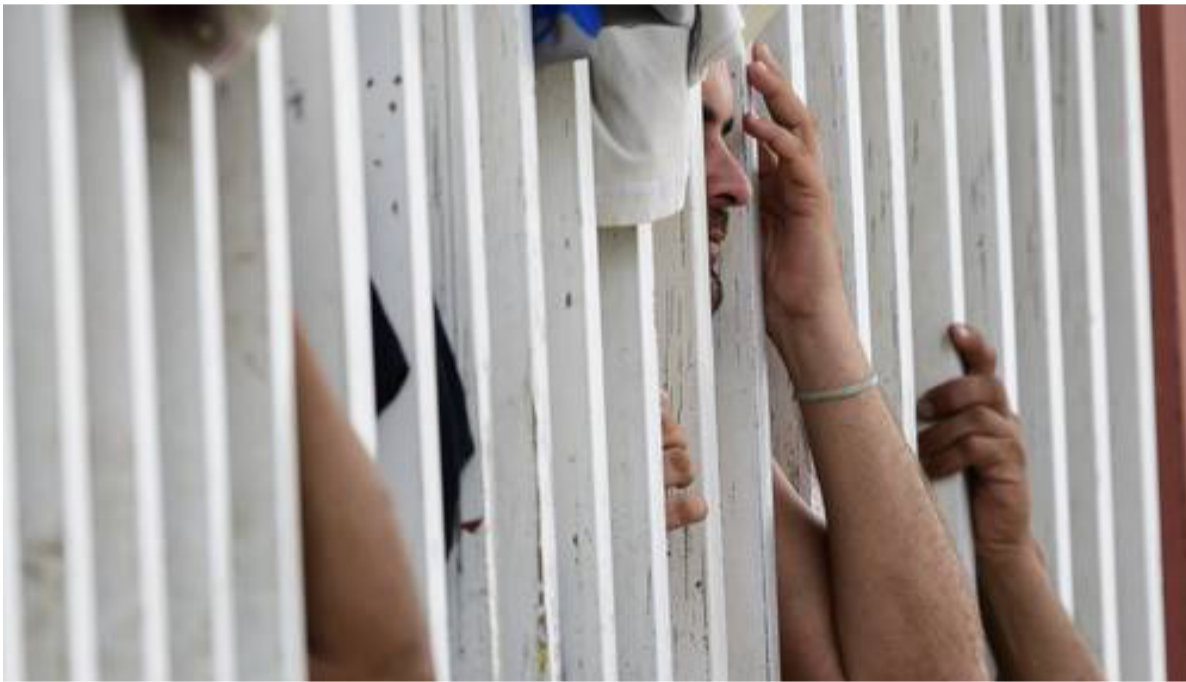
Migrantes centroamericanos en un albergue católico en Tapachula, Chiapas

Para volver a los centroamericanos y su lucha y determinación por lograr una vida humana , decente, necesitamos ser solidarios con ellos y no caer presas de los falsos slogans y acciones chauvinistas limitadas.