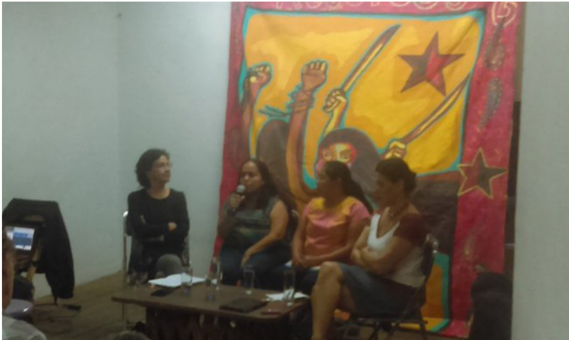
Foro “Violencias múltiples y despojo”

La apuesta por la vida tiene que crear alianzas entre la defensa del territorio y estos movimientos de madres que están buscando a sus hijos en defensa de la vida. Urge que denunciemos dónde están apareciendo las fosas, dónde están los desplazados y qué está llegando cuando las comunidades se desplazan. Decía el señor yoreme: “Están vendiendo. Cuando hay miedo, ya no podemos vivir aquí porque hay muchas desapariciones, vamos a tener que vender.” Casualmente, uno de los municipios con más desapariciones fuerza-