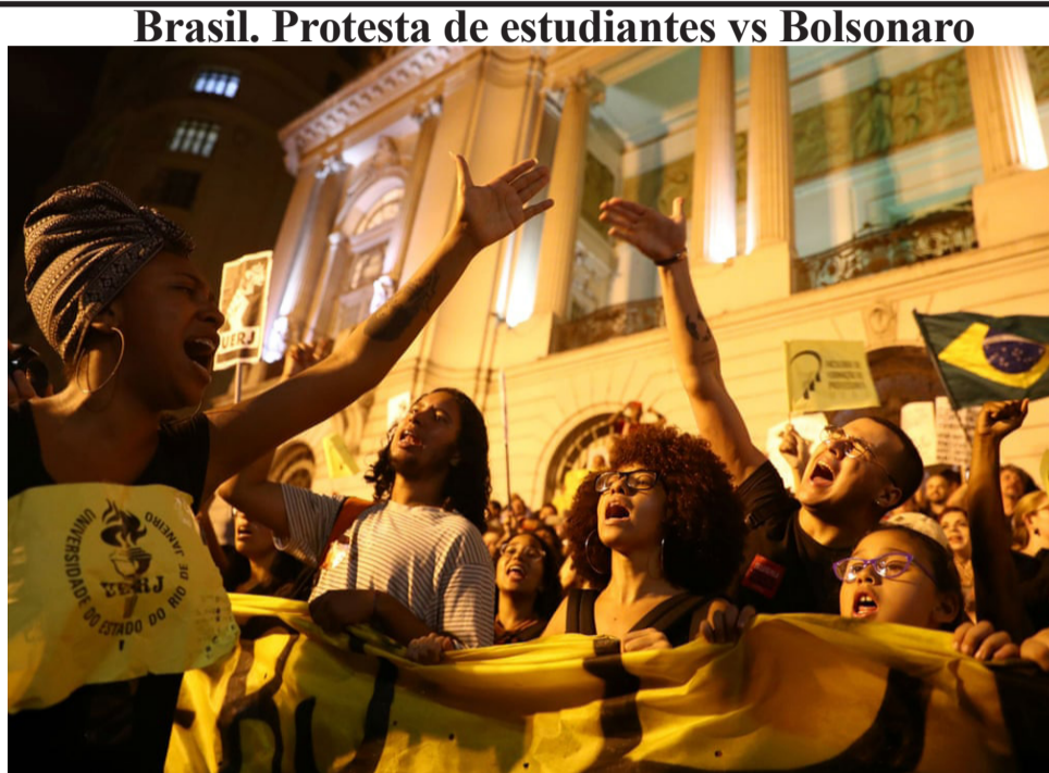
Brasil. Protesta de estudiantes vs Bolsonaro

Voces de la revolución en Sudán: “[El viejo régimen] todavía está representado por las fuerzas de seguridad y por la economía. Ellos tienen grupos paramilitares, y todavía tienen armas y dinero. Nosotros tenemos una oportunidad [...] No podemos esperar”.