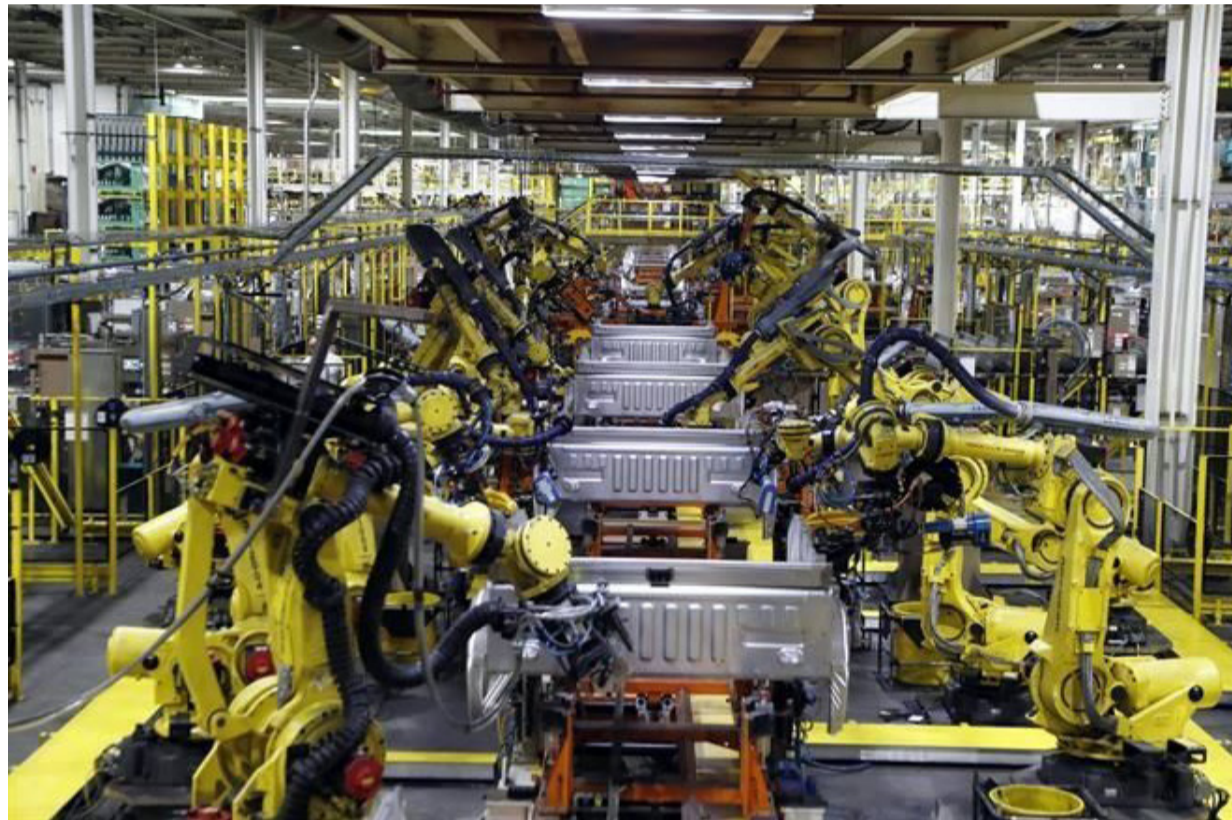
Producción automatizada en Estados Unidos

La palabra favorita de los economistas de hoy es "desacoplar". Peter F. Drucker escribió para Foreign Affairs (Spring, 1986) sobre "The Changed World Economy". Allí, insiste arrogantemente, y sin embargo de manera poco elaborada (como si los cambios de los que está hablando fueran el verdadero estatus de la economía mundial), en que es necesario reconocer las tres verdades del "desacoplamiento" que él describe con detalle: