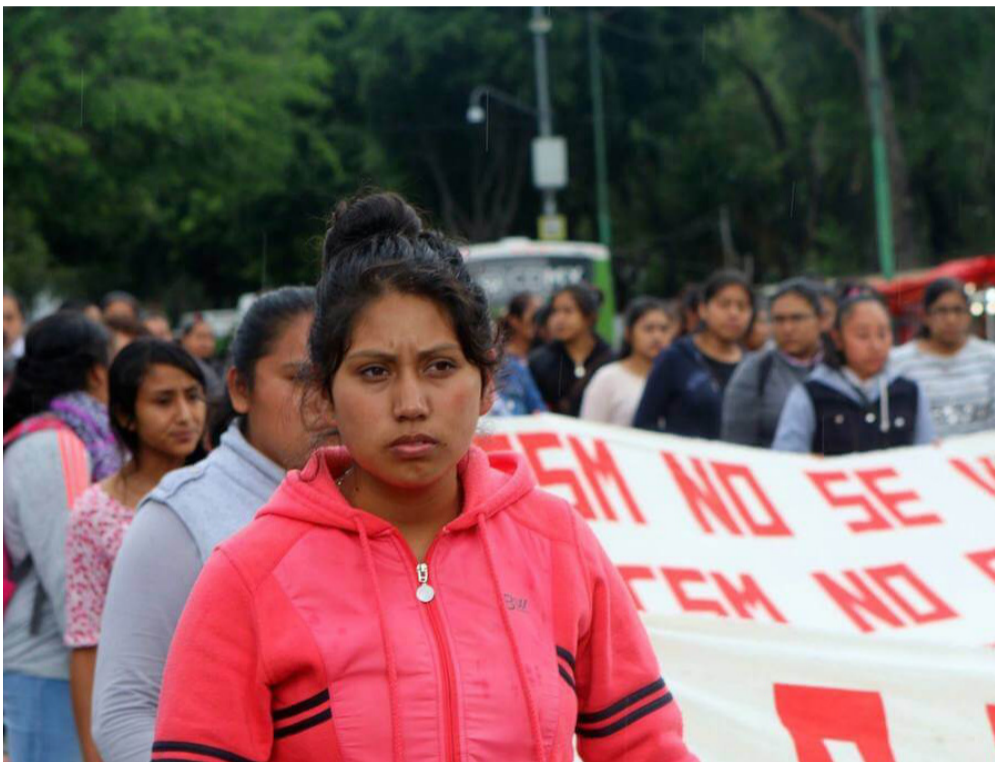
Marcha de normalistas el 8 de julio en la Ciudad de México

Antes de entrar a una normal rural, se puede tener una idea errónea de lo que es ser un normalista, por-