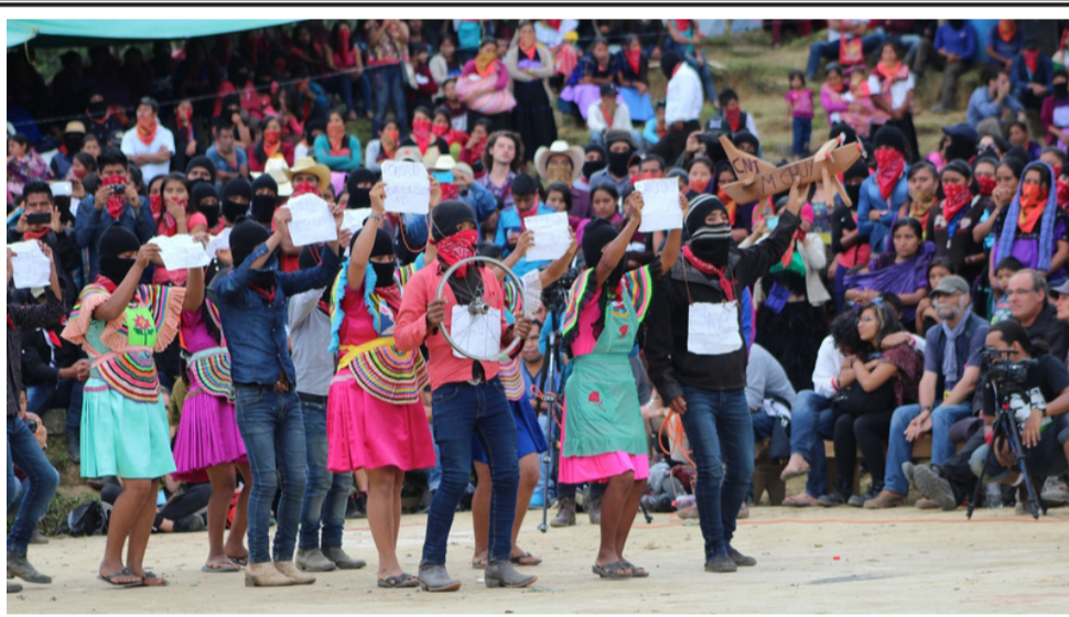
Festival zapatista CompArte por la Humanidad (pág. 11)

(1) Para una breve historia de cómo los maestros en protesta han resistido a la "reforma educativa" (léase: imposición laboral ) del gobierno, ver Un año de resistencia magisterial: ¿qué significa?, ¿hacia dónde ir ahora? , recopilación de artículos y entrevistas de Praxis en América Latina sobre la lucha de la Coordinadora Nacional de Trabajadores de la Educación (CNTE) en 2016 ( http://www.praxisenamericalatina.org/la_lucha_magisterial.pdf ).