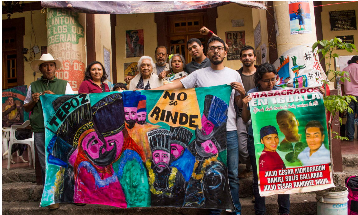
Plantón en el palacio municipal de Tepoztlán

van para la vocera y para todas las mujeres de este mundo, que saben de los sufrimientos, de los goces. Ya es hora de que la mujer participe de una manera presente y enérgica. Y, a los hombres, a animarlos a que se unan, a que caminemos juntos. La mujer representa la dignidad, la lucha, la esperanza, la fortaleza. Ella ya ha iniciado y, así, paso a paso, vemos cómo ella va exponiendo la razón que tenemos sobre la participación de la mujer en esta lucha por la defensa de la vida.