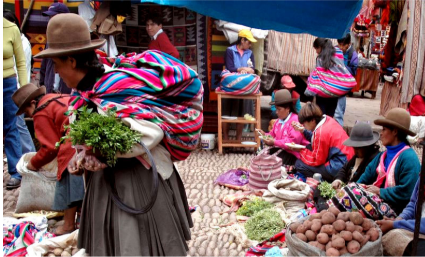
Mujeres en el mercado de P'isaq, Perú

Hablar del proyecto educativo Kusi Kawsay ( Vida Venturosa ) antes mencionado, es una manera de demostrar y difundir iniciativas únicas que incentivarán a la preservación de nuestra cultura inca, ya que se rige bajo los mismos pilares.