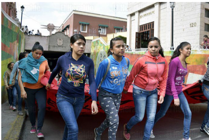
Mujeres normalistas protestando

Yo lucho por la educación, porque mis alumnos tengan una educación digna, completa. Yo recibí la mejor educación; tuve unos maestros excelentes que me enseñaron a ir más allá de un libro, de un salón: [a] llegar a la vida de mis alumnos. Te pido que me ayudes, si tú saliste de esta normal, [a decir que] no somos unas delincuentes: nos respaldan nuestros alumnos, nuestros compañeros, las escuelas en las que estamos. En este momento, yo me encuentro en Querétaro; aquí estoy ejerciendo mi profesión de la mejor manera que puedo. Recuerdo [que], al salir de Cañada Honda, me dieron este anillo y me dijeron: “En donde quiera que te pares, pon en alto el nombre de tu escuela”. Ahorita la estoy tratando de