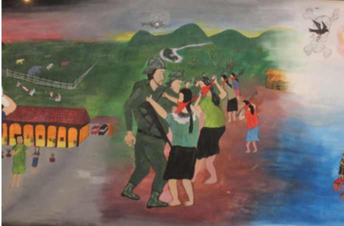
La lucha de las mujeres, obra del festival CompArte

salario, no está regulado, es doble chamba y, además, implica una dependencia directa hacia el hombre). ¿Cómo desafían las mujeres las propias masculinidades? Porque el hombre también está oprimido, y la lucha no es contra él, sino contra el capitalismo.