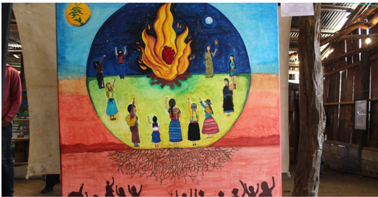
Obra del festival CompArte por la Humanidad

P: ¿Cuál ha sido tu experiencia a lo largo de estos días en el festival CompArte?