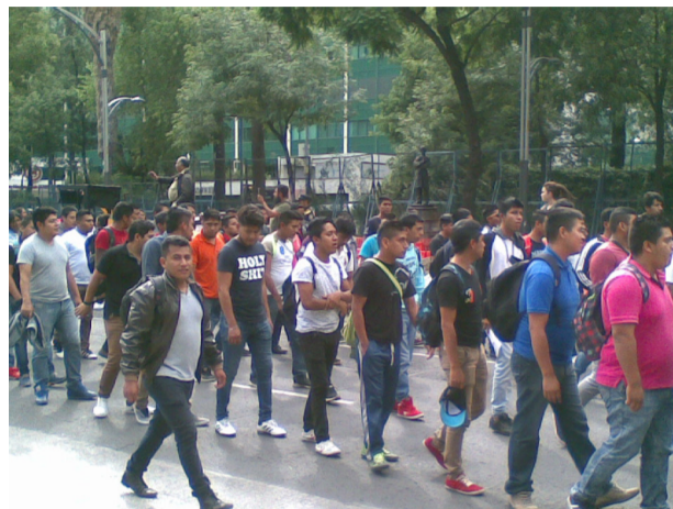
Normalistas en marcha por Ayotzinapa

O: En los primeros días de la desaparición de nuestros compañeros de Ayotzinapa, por ejemplo,