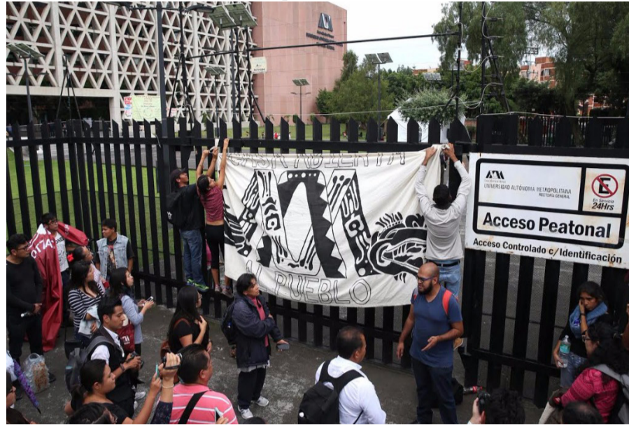
Asamblea estudiantil en la UAM

En general, las exigencias de los pliegos petitorios eran muy similares y se concentraban principalmente (aunque no sólo) en la transparencia del ejercicio presupuestal, ya que lo que se alegaba desde un inicio era el desvío de recursos que se viene llevando a cabo desde hace tiempo dentro de la universidad, y que impacta evidentemente de forma negativa en la investigación y el desempeño académico. La mayor parte del mes de julio los estudiantes insistieron en reunirse con las autoridades para discutir el pliego petitorio y recibir una respuesta a sus demandas, pero los funcionarios declinaron en varias ocasiones —y, a las reuniones a las que decidieron asistir, sólo lo hicieron para mostrar su in-