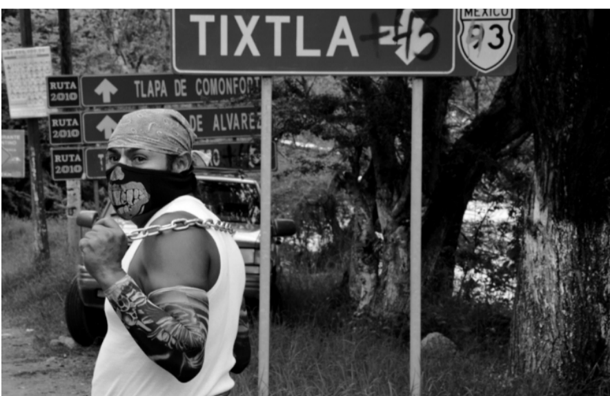
Un hombre enmascarado junto a una señal de tránsito que tiene pintado el número 43. Tixtla, Guerrero