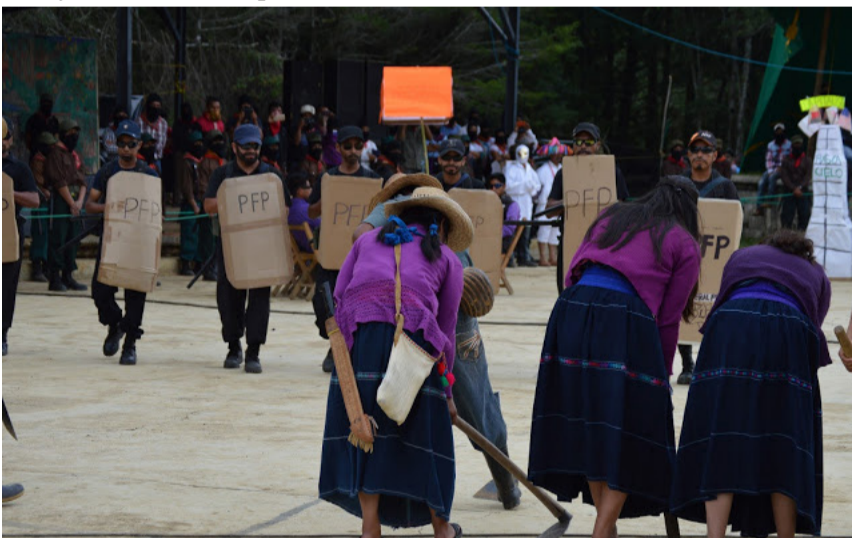
Presentación zapatista en el CompArte en Oventic

El arte, hermanas y hermanos, compañeras y compañeros, es tan importante porque es el que da una ilustración de una nueva cosa en la vida, tan diferente y que puedes comparar con lo ilustrado en la vida real, que no miente. Es tan poderoso el arte, porque es una vida real ya en las comunidades donde ellas y ellos mandan y su gobierno obedece: gracias al arte de la imaginación y saber convertir en una nueva sociedad, en una vida común. Demuestra que sí se puede otra forma de gobernarse, totalmente diferente; que sí es posible otra vida trabajando comúnmente en beneficio de la misma comunidad.