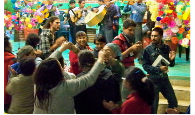
CompArte en el Cideci, San Cristóbal de Las Casas

Praxis en América Latina estuvo presente los días 27 y 28 de julio en el Cideci-UniTierra y, el 30, en Oventic, en el Festival Comparte, convocatoria abierta que lanzaron los zapatistas para invitar a artistas y espectadores de todos los continentes a compartir su arte, desde una concepción de sí mismos.