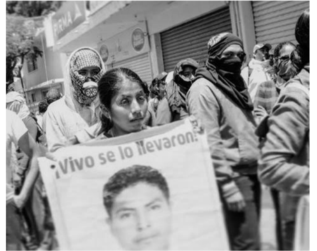
Manifestación por los 43