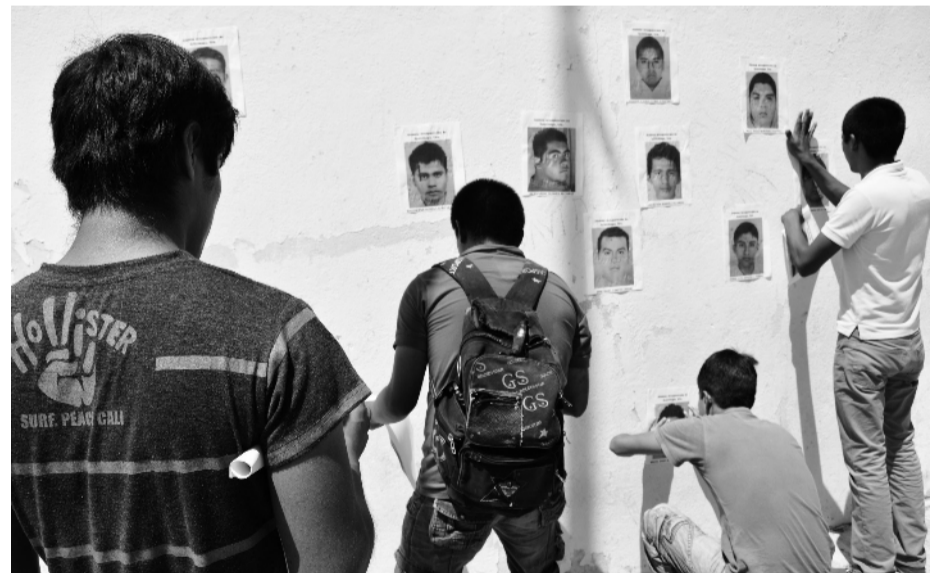
Compañeros de clase de los estudiantes desaparecidos de la escuela normal de Ayotzinapa pegan afiches con los rostros de sus amigos en la plaza principal de Tixtla, Guerrero