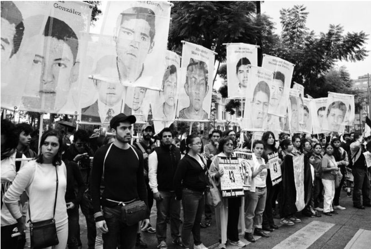
Los manifestantes se detuvieron en la avenida Juárez de la Ciudad de México durante la marcha por el primer aniversario de la desaparición de los 43 estudiantes