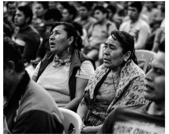
Madres de Ayotzinapa