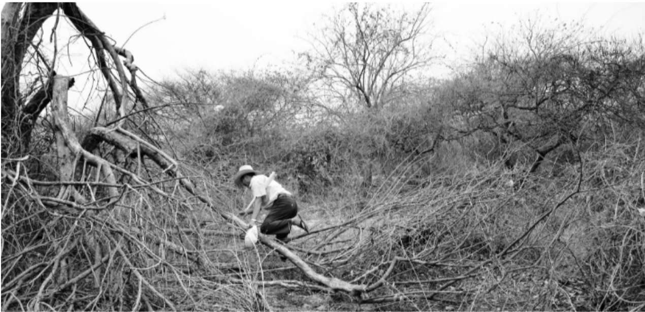
Bernardo Campos durante la jornada de búsqueda en la montañas cercanas a Iguala