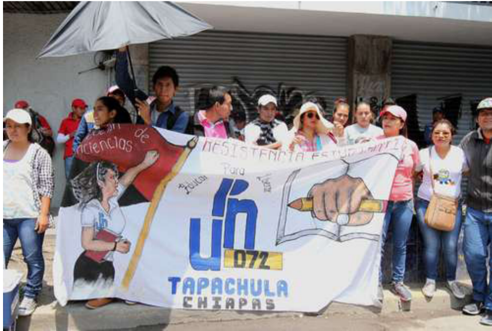
Protesta de padres y madres de familia en Chiapas

Estamos en esta lucha a fondo y hasta la lograr la abrogación de la nefasta reforma educativa [...] Somos parte de este movimiento que ya no sólo es magisterial. Preferimos perder un ciclo escolar, a perder la educación de toda la vida para nuestros hijos [...] No nos pre-