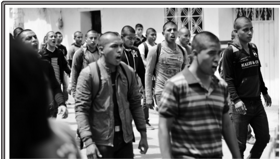
A dos años de Ayotzinapa Fotografías en la pág. 12